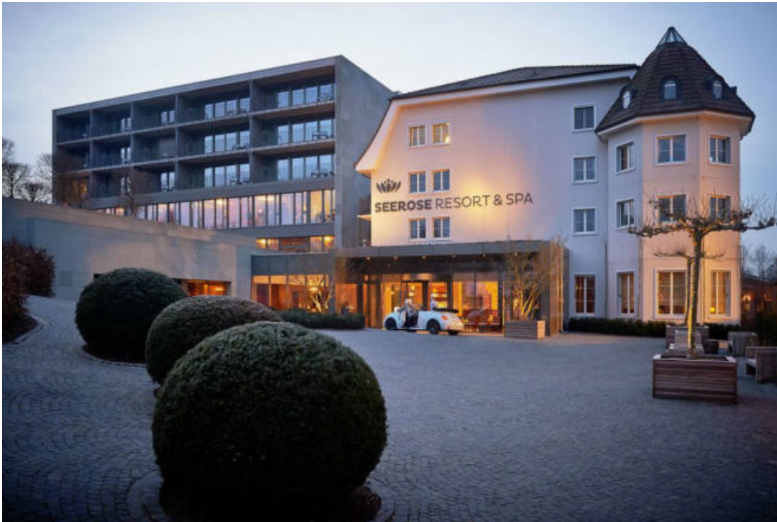
Gaumen und Seele werden im Seerose Resort & Spa verwöhnt. (Seerose Resort & Spa)