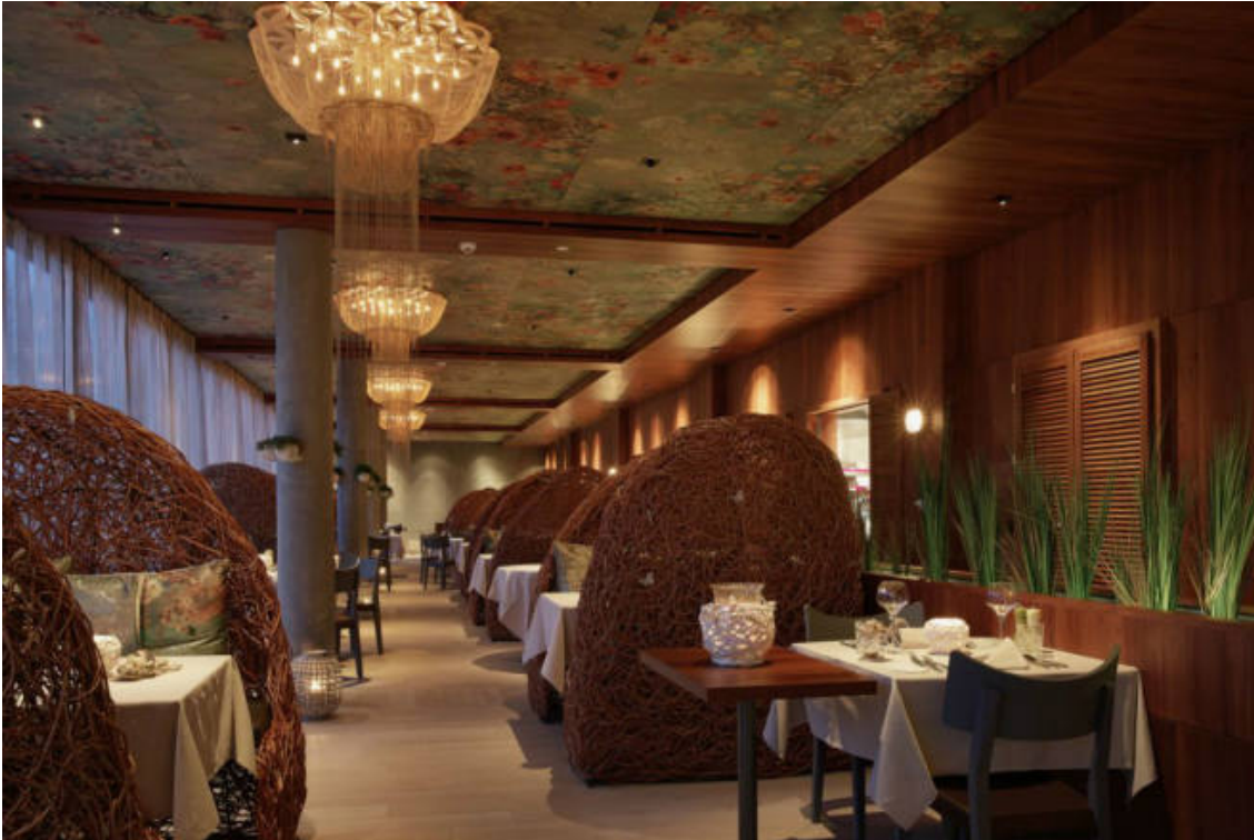
Restaurant Cocon (Seerose Resort & Spa)

Referenz: 71760135 Ausschnitt Seite: 6/6