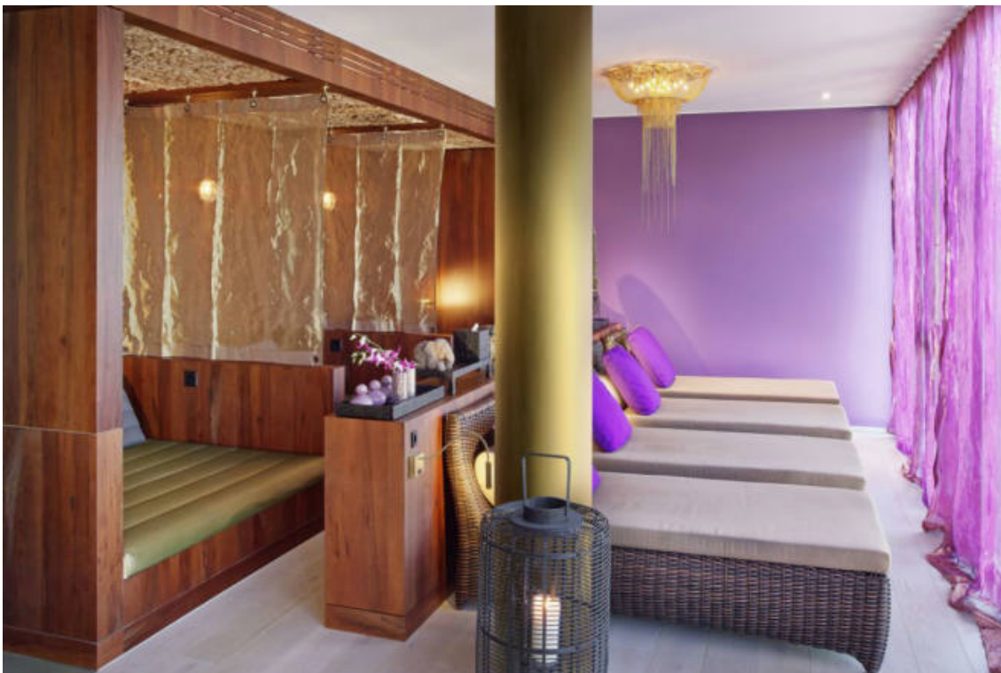
Im Ruheraum des Cocon Thai Spa kann man die Seele baumeln lassen.