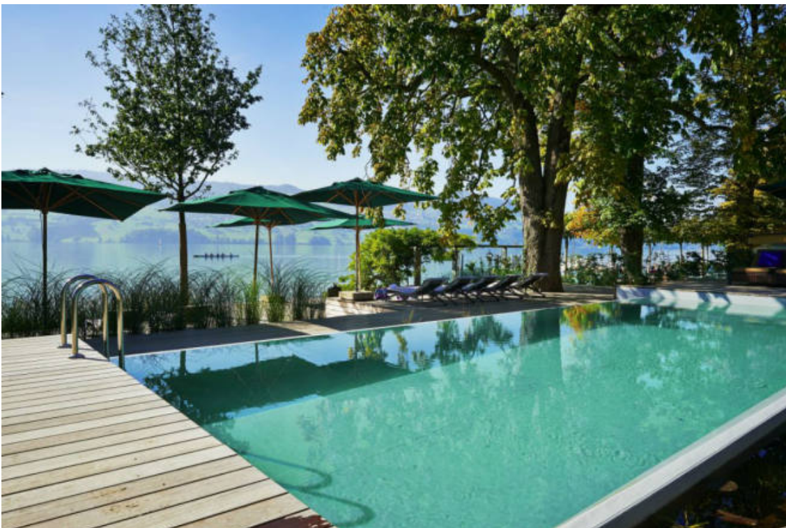
Herrliche Aussicht auf den Hallwilersee (Seerose Resort & Spa)