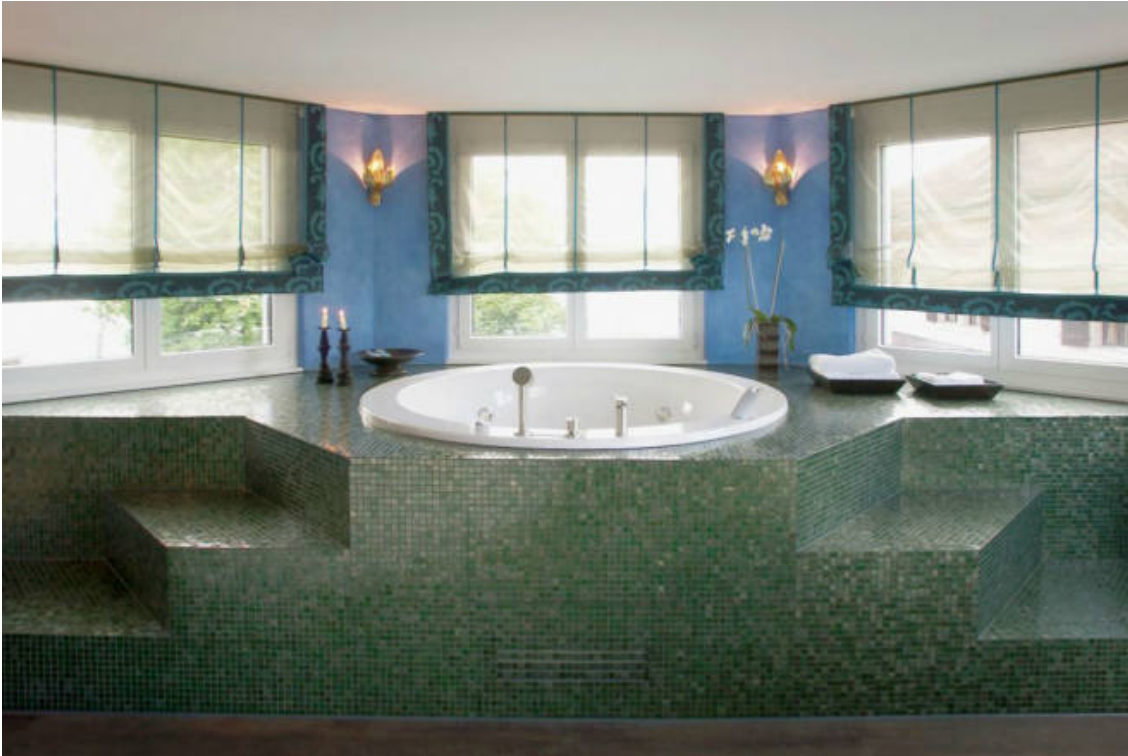
Whirlpool in der Thai-Suite (Seerose Resort & Spa)