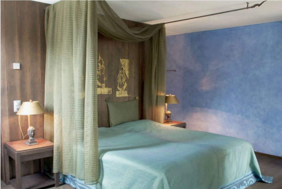
Himmelbett für süsse Träume in der Thai-Suite (Seerose Resort & Spa)

Referenz: 71760135 Ausschnitt Seite: 5/6